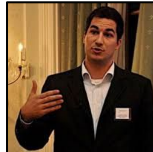
Kerekes Joki, Svájc